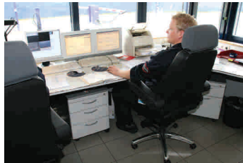
24Stunden Drehsessel auf RECARO Basis