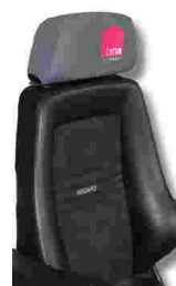
RECARO 24H Drehsessel