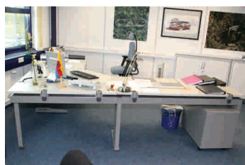
Alte Tische mit fester Höhe 72 cm

Die vorgefundene Arbeitsplatzausstattung entsprach den gesetzlichen Mindestanforderungen (BildschirmAV). Die Arbeitstische wurden bei Gründung der ATP vor ca. 10 Jahren angeschafft. Dabei handelte es sich um große Winkelarbeitsplätze mit einer für Bildschirmarbeit vorgesehenen großen Eckplatte.