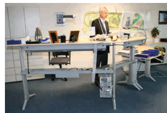
an seinem neuen Arbeitsplatz